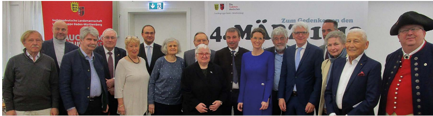
Feierstunde der Landesgruppe Baden-Württemberg der Sudetendeutschen Landsmannschaft zum Jahrestag des „4. März 1919“ am 3. März 2024 im „Haus der Heimat“ in Stuttgart: