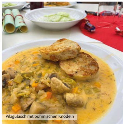
Pilzgulasch mit böhmischen Knödeln

des Sudetenlandes. Der BdV freut sich schon auf den nächsten Kochkurs, der Rezepte aus anderen Regionen wie dem Banat, Pommern oder Siebenbürgen erkunden könnte.