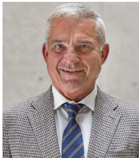
Thomas Strobl stellvertretender Ministerpräsident, Minister für Inneres, Digitalisierung und Migration, Landesbeauftragter für Vertriebene und Spätaussiedler

und Spätaussiedler wissen, was es heißt, „Hab und Gut“ zu verlieren und in der Fremde einen Neuanfang zu wagen. Sie kennen aus eigener Erfahrung Leid und bringen Mitgefühl für andere Menschen auf, die ebenfalls schwere und entbehrungsreiche Zeiten durchgemacht haben. Die Martinslegende veranschaulicht uns, wie aus Mitgefühl aktive Hilfe erwächst. Und genauso zeigen die landsmannschaftlichen Hilfsorganisationen, die in der Nachkriegszeit entstanden und zum Teil bis heute aktiv sind, was es bedeutet, Hilfe und Fürsorge für andere zu leisten.