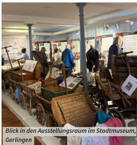
Blick in den Ausstellungsraum im Stadtmuseum, Gerlingen

Debatte über die Sprache im Europäischen Parlament – während viele für Esperanto plädierten, sprach sich Habsburg für Latein aus, um niemandem