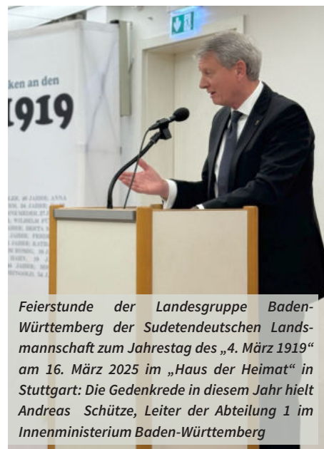
Feierstunde der Landesgruppe Baden-Württemberg der Sudetendeutschen Landsmannschaft zum Jahrestag des „4. März 1919“ am 16. März 2025 im „Haus der Heimat“ in Stuttgart: Die Gedenkrede in diesem Jahr hielt Andreas Schütze, Leiter der Abteilung 1 im Innenministerium Baden-Württemberg