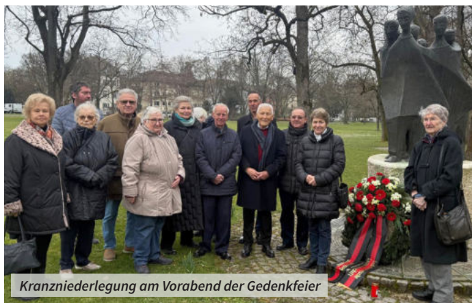
Kranzniederlegung am Vorabend der Gedenkfeier

sondern integriert, und das Selbstbestimmungsrecht der Völker uneingeschränkt anerkennt.