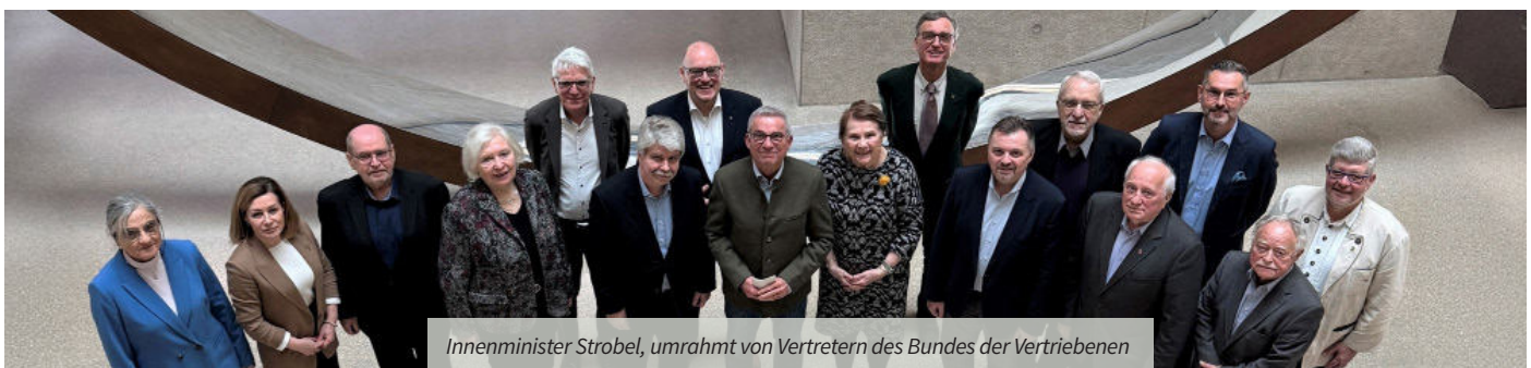
Innenminister Strobl, umrahmt von Vertretern des Bundes der Vertriebenen

Bildung. Innenminister Strobl hörte geduldig zu, gab erste Aufträge an die Mitarbeiterinnen des verantwortlichen Referats weiter und versprach sich auch zukünftig für die Belange der Heimatvertriebenen und Aussiedler einzusetzen.