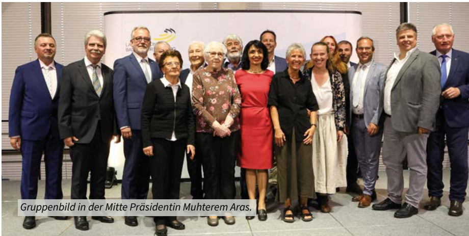
Gruppenbild in der Mitte Präsidentin Muhterem Aras.