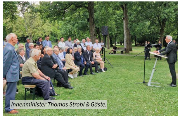
Innenminister Thomas Strobl & Gäste.

Minister Thomas Strobl erinnerte an die Bemühungen auf gesellschaftlicher und politischer Ebene, die erforderlich waren, um dem Schicksal der deutschen Heimatvertriebenen einen angemessenen Platz in der gemeinsamen europäischen Geschichte einzuräumen. Ein zentraler Meilenstein auf diesem Weg sei die Einführung des bundesweiten „Gedenktags für die Opfer von Flucht und Vertreibung“ im Jahr 2015 gewesen. Der Landesbeauftragte für Vertriebene und Spätaussiedler lädt traditionell zu einer Gedenkfeier am Mahnmal für die