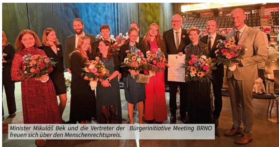
Minister Mikuláš Bek und die Vertreter der Bürgerinitiative Meeting BRNO freuen sich über den Menschenrechtspreis.

Seit 2015 führt „Meeting Brno“ mit vielen