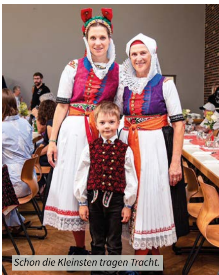
Schon die Kleinsten tragen Tracht.