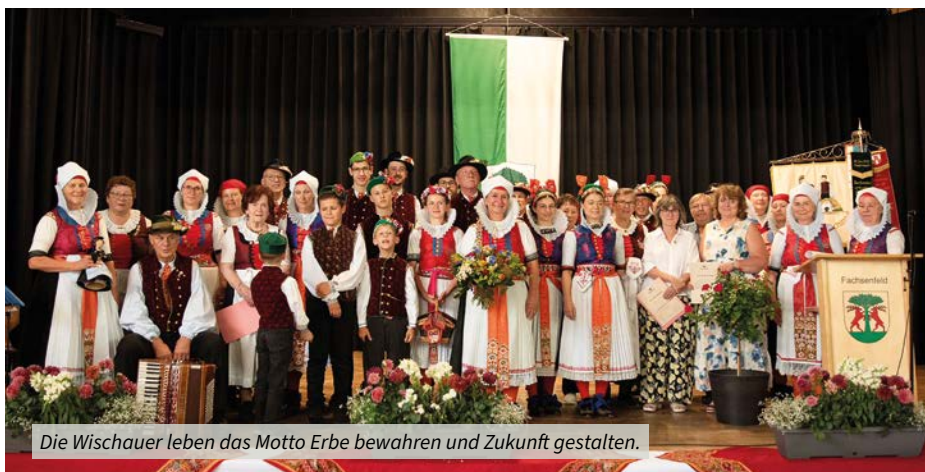
Die Wischauer leben das Motto Erbe bewahren und Zukunft gestalten.

in der Fachsenfelder Kirche. In seiner Predigerinnerte er eindrucksvoll an das Ende des Zweiten Weltkriegs vor 80 Jahren und die folgenden Jahre der Vertreibung. Besonders würdigte er die in alten Wischauer Hauben eingestickte christliche Symbolik, die bis heute das Bekenntnis zum katholischen Glauben dokumentiert.