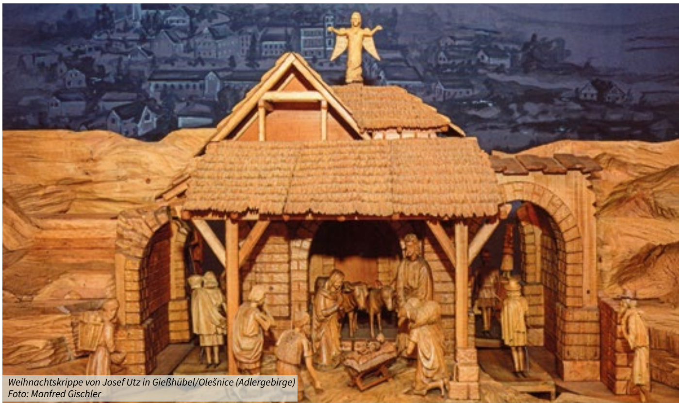
Weihnatskrippe von Josef Utz in Gießhübel/Olešnice (Adlergebirge)

Sudetendeutscher Tag 2026 wirft Schatten voraus