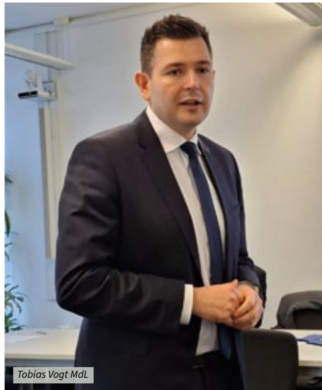
Tobias Vogt MdL

Die Mitglieder der Union der Vertriebenen, Aussiedler und deutschen Minderheiten Baden-Württemberg (UdVA) trafen sich vor kurzem zu ihrer Landesversammlung in der CDU-Landesgeschäftsstelle in Stuttgart. Im Mittelpunkt der Tagung stand neben einer Rede des baden-württembergischen CDU-Generalsekretärs, Tobias Vogt MdL, die Wahl des neuen Landesvorstandes der UdVA Baden-Württemberg.