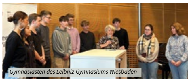
Gymnasiasten des Leibniz-Gymnasiums Wiesbaden

Kulturstiftung der Deutschen Vertriebenen