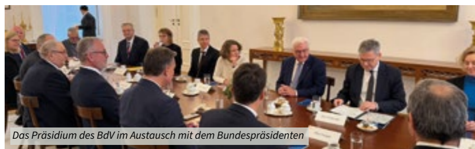
Das Präsidium des BdV im Austausch mit dem Bundespräsidenten

Das Gespräch machte deutlich, dass die Politik für Vertriebene, Aussiedler und deutsche Minderheiten fester Bestandteil deutscher und europäischer Politik bleibt. Primas unterstrich im Nachgang: „Die UdVA – und mit ihr die Unionsparteien – wird ihre Verantwortung für die Vertriebenen, Aussiedler und deutschen Minderheiten weiter konsequent wahrnehmen.“