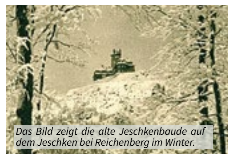
Das Bild zeigt die alte Jeschkenbaude auf dem Jeschken bei Reichenberg im Winter.

Zu jeder Jahreszeit lädt die Region Reichenberg/Liberec zu einem Besuch ein. Im Winter werden die Berge und Täler dann zu einem echten Winterparadies. So lockt heute schon die Region, in der neben Abfahrts- und Langlauf auch romantische Spaziergänge möglich sind zum weit über die Grenzen bekannten Isergebirgslauf.