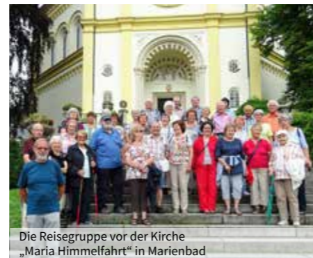
Die Reisegruppe vor der Kirche „Maria Himmelfahrt“ in Marienbad

Kaiserwald ging es danach nach Karlsbad. Die Stadt besticht durch eine überall zu bestaunende Architektur in herrlicher Natur. Zurück in Marienbad war jeder voller einmaligen Eindrücke. Am nächsten Tag war der Besuch von Prag angesagt, das nach 3 stündiger Fahrt erreicht wurde. Den ersten Eindruck von dieser schönen Stadt erhielt jeder auf der Prager Burg. Eine imposante Wachablösung empfing die vielen Besucher gleich am Burgtor. Im ersten Burghof fiel gleich auf, dass die Burg von unzähligen Gruppen immer besucht wird. So konnte der Veitsdom nur in einer sehr langen Besucherschlange erreicht werden. Ein herrlicher Blick auf Prag und die Moldau war auf der großen Terrasse möglich, von wo auch das Gebäude des „Prager Fenstersturzes“ zu sehen war. Über die Czech-Brücke erreichten die Reisetilnehmer den Altstädter-Ring und den Wenzelsplatz. Die Reiseleiterin konnte bei den Spaziergang durch die Straßen und Gassen auf unzählige Baudenkmäler hinweisen. Am Abend ergab sich im Hotel noch ein „Böhmisches Abendessen“ und ein Alleinunterhalter würzte mit seinen Melodien die Geselligkeit. Der Tag der Heimreise war gekommen. Pilsen, die Hauptstadt des Bieres, wur-