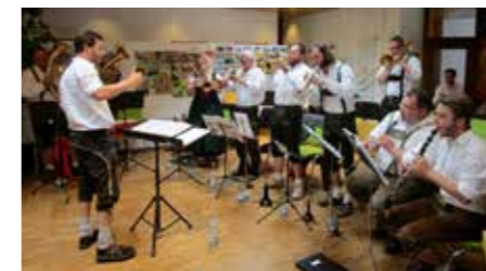
„d` Weilis Blossmusik“ sorgte für böhmische Stimmung.

einen großen Anteil an der Entwicklung Deutschlands hätten und der Wohlstand